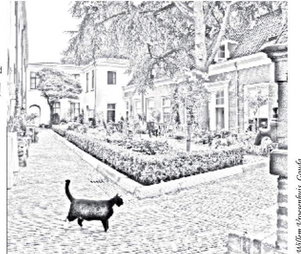
Willem v. Resenfruis, Gouda

Telefoon (0182) 59 70 70 E-mail vestiging.gouda@woonpartners-mh.nl Website www.woonpartners-mh.nl